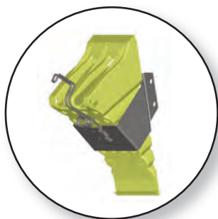
Opcional Suporte galvanizado